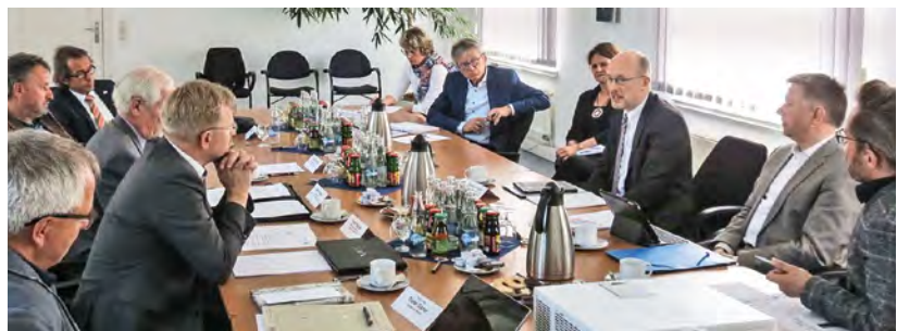
Minister Pegel (3. v. r.) im Gespräch mit den Kammer- und Hochschulvertretern

Ingenieurkammer und Ingenieurrat haben anlässlich von Gesprächen und Aktivitäten immer wieder auf die drastischen Auswirkungen hingewiesen, wenn es nicht gelingt, altersbedingt ausscheidende Ingenieure in den Planungs-, Ingenieur- und Architekturbüros, im Bauwesen und in der öffentlichen Verwaltung zu ersetzen. Die Absolventenzahlen reichen nicht aus,