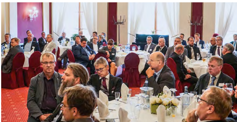
Neben den Parlamentariern waren einige Hochschulvertreter der Einladung gefolgt.

Die Ingenieurkammer nutzte die Gelegenheit, den Parlamentariern das sogenannte „BLU-Konzept“ zur Verbesserung der Ingenieurausbildungssituation in Mecklenburg-Vorpommern zu überreichen. Die Parlamentarier sicherten zu, weiter mit den Beteiligten im Gespräch zu bleiben und gemeinsam an Lösungen zu arbeiten.